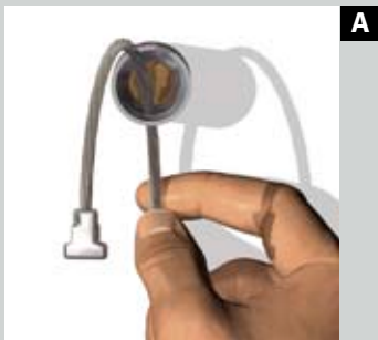
Wandmontage met Twister™-kabel Montage mural avec câble Twister™